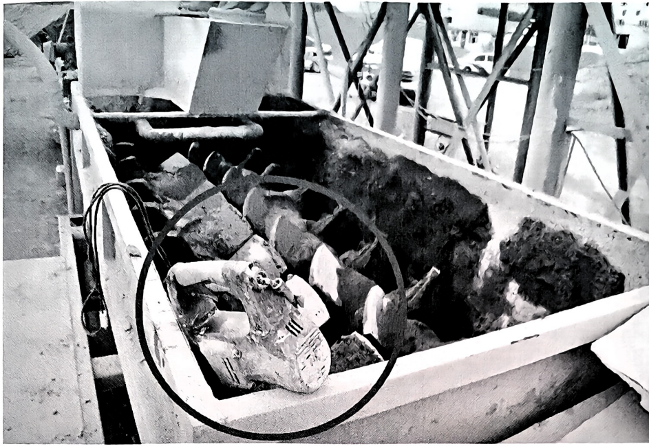
图 3 事故设备