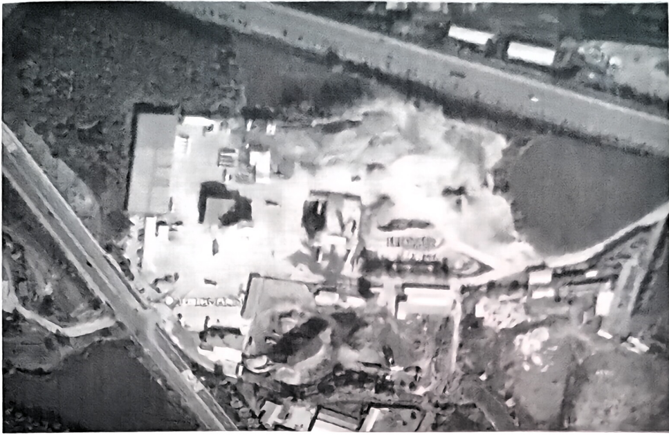
图 1 事故发生地